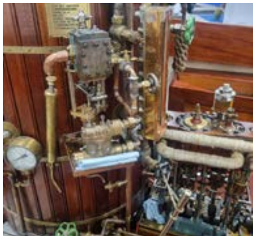
Donkey-pump i Ina af Öja.