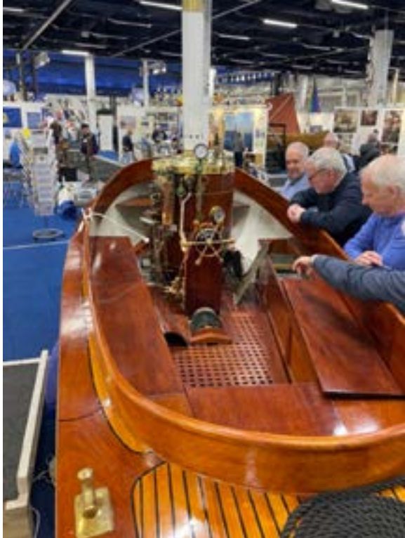
Besökare beundrar mästerverket.