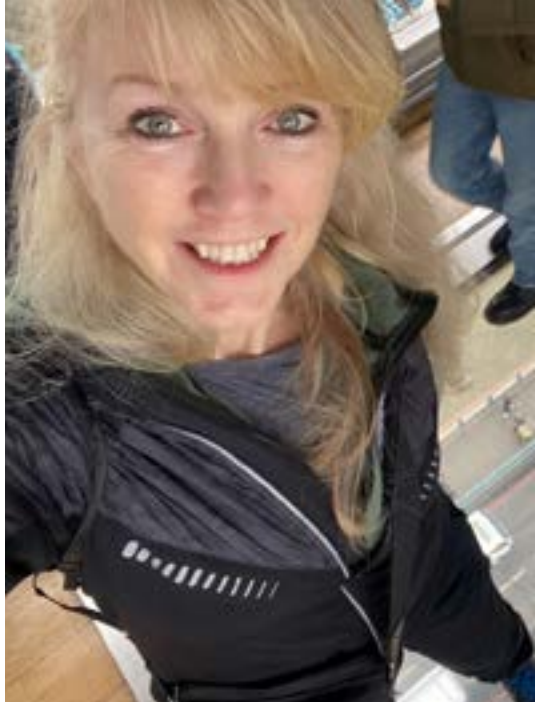
Svindlande utsikt från gångbron

Maskinrummet i Tower Bridge är öppet för allmänheten och vilka majestätiska skönheter som uppenbarar sig där inne! (Man kan med fördel planera besöket genom att beställa biljett i förväg för viss tidsperiod för att slippa köa.) Förutom att njuta av synen av det omfattande maskineriet i sig finns det också möjlighet att fördjupa sig i fakta om anläggningen via tekniska skisser och informationstavlor.