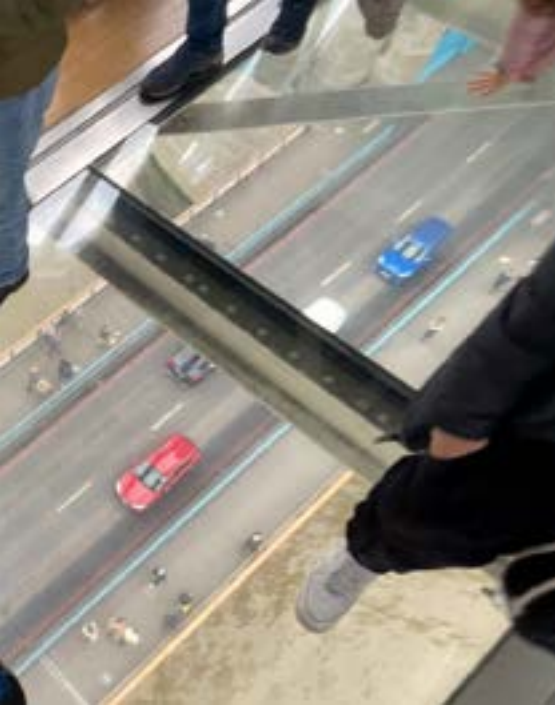
som sedan 2014 har ett golv av glas.