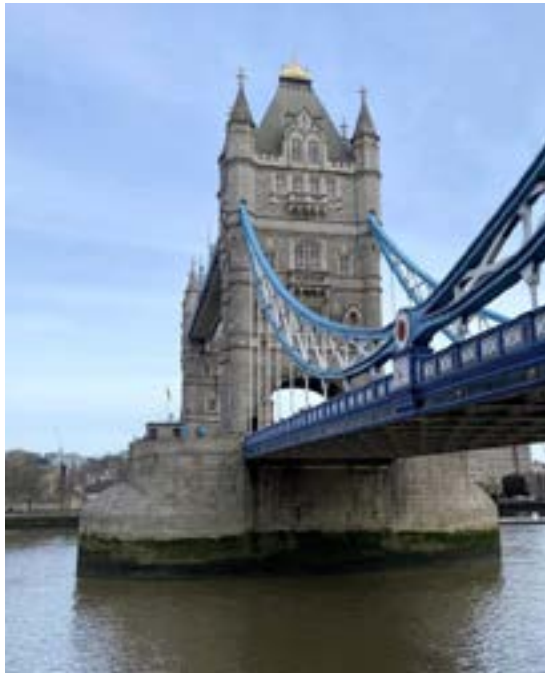
Tower Bridge är en välkänd profil i London,

Nuförtiden sker broöppning mer sporadiskt några gånger i veckan eftersom de högmastade segelfartygens tid är förbi och alla stora fraktfartyg numera lägger till några mil utanför London, men när bron var ny öppnades den mellan 20 och 30 gånger om dagen. På den tiden krävdes det förstås även stor bemanning – mer än 80 personer arbetade med maskineri och teknik och eldarna förbrukade över 20 ton kol per vecka innan man 1976 bytte till modernare teknik.