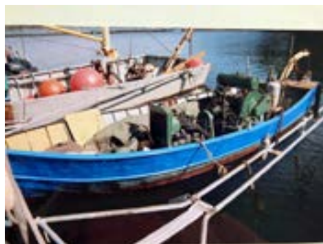
Flottningsbåt från Umeå 1953.

Det finns olika typer skyltar för fritids- och yrkesfartyg att sätta upp på farkosten. □