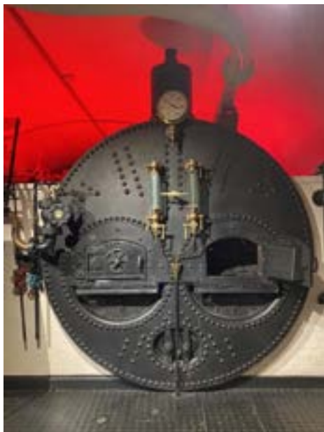
Ångpannan i Tower Bridge, se sid. 12-13.

Ångpannan i exemplet tar en dryg timme på sig för att nå 10 bar. Naturligtvis kan pannor värmas snabbare eller långsammare men kurvans utseende blir i princip detsamma vid konstant eldning. □