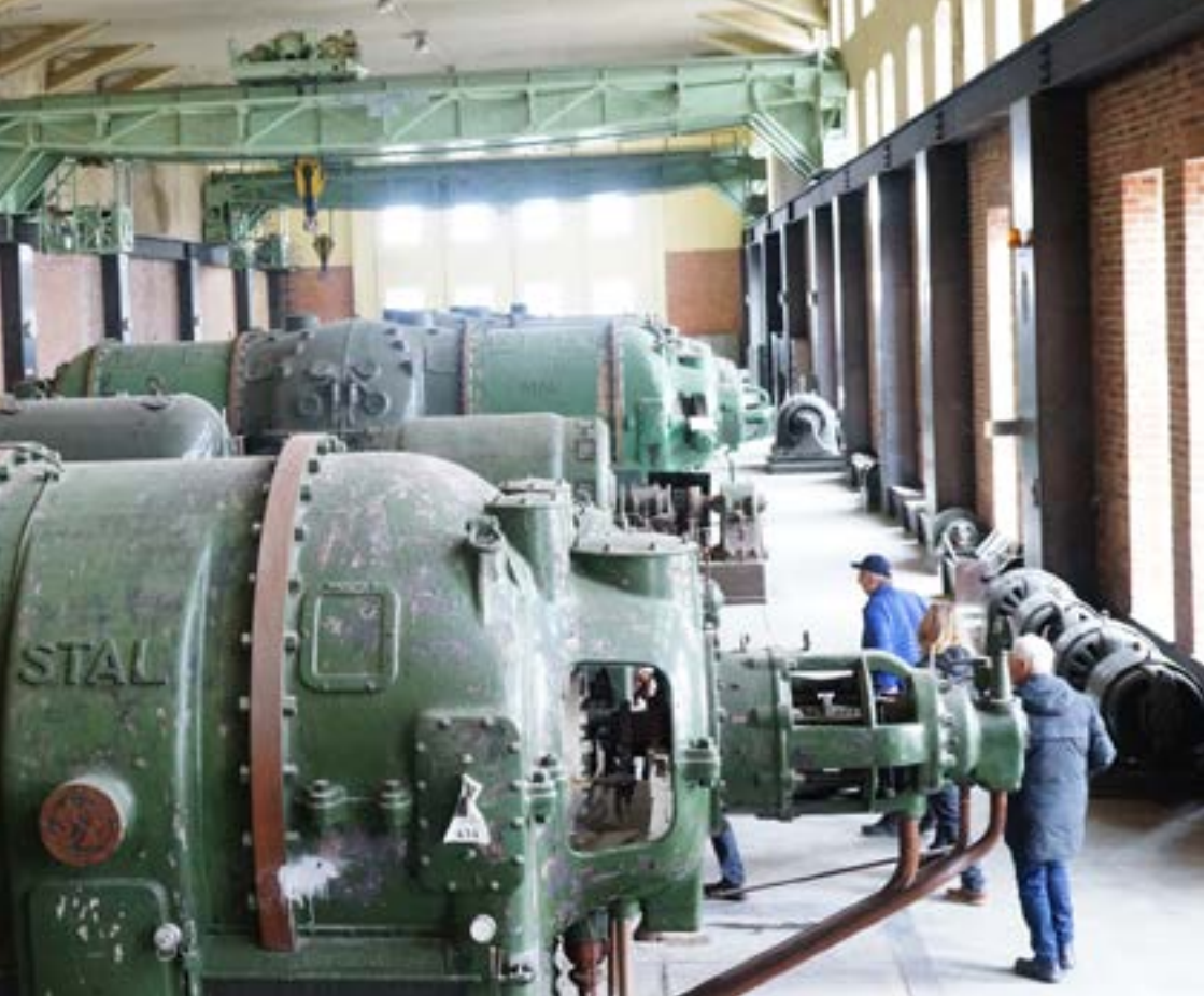
Sju bevarade turbingeneratorer från STAL och ASEA.