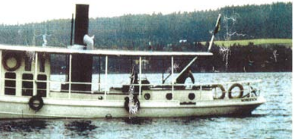
Hebe försedd med tak 2018.