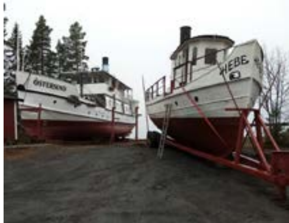
Östersund och Hebe vid slipen i Arvesund.