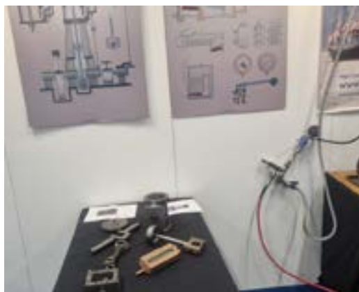
Utbildning på båtmässan.