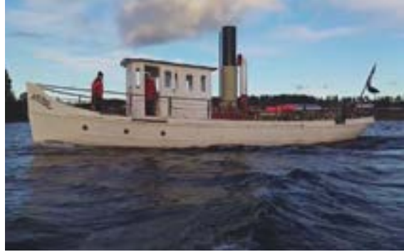
Hebe på kvällstur 2020.