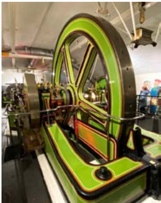
Vacker ångmaskin. Ångpannan ses på sid. 19.