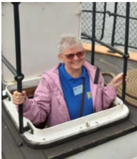
Maggan tittar upp ur Herbert.