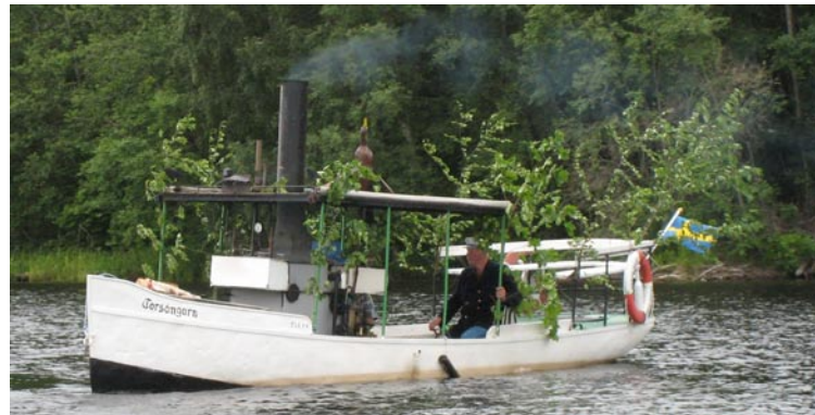
Kjells ångslup Torsångaren.