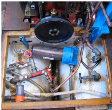
Längst ner i kölen skymtar “brunnen” med luftningsröret och anslutningen till bottenventilen till vänster.

Jag hade samma problem i början med Stimmaren. Jag tillverkade en “vattenbrunn” där luften kunde avskiljas. Ett ca 50 mm Ø och 350 mm långt rör försågs med anslutningar. En anslutning högt upp för matarvattnet från sjön. En anslutning i botten för matning till Maskinmatarpumpen och ett längst upp för dränering av luften. Detta rör gick högre än nivån på sjövattnet, även en kran monterades som stängdes när man lämnade båten. Röret placeras stående så långt ner i kölen som möjligt. Sedan var problemet med luft i matarpumpen löst.