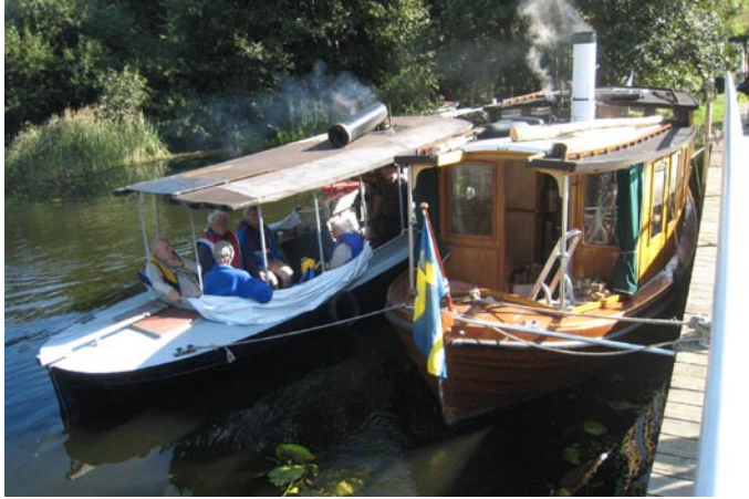
Barcarolle och Stimmaren vid slussen i Sickla.