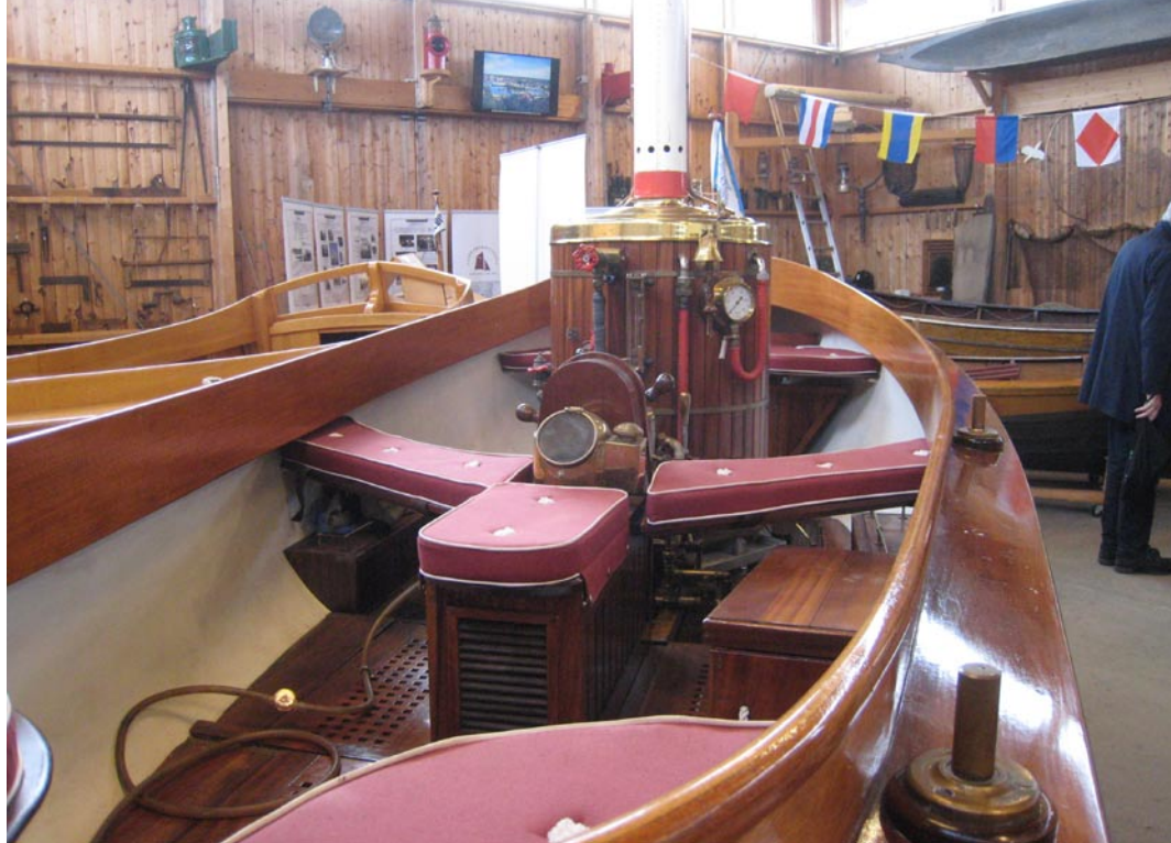
Sjöfartsutställningen i Båt- och maskinmuseet är mycket trevligt presenterad.

Fredrik Hellsberg fick svara på en del frågor. Bl a: Arbetsmiljöverket har utarbetat föreskrifter, AFS 2017:3, för skötsel av ångpannor med krav på eldarcertifikat för skötare av dessa. Eftersom eldare ombord på passagerarfartyg har dessa kunskapskrav inarbetade i sin utbildning gäller inte Arbetsmiljöverkets krav för sjömän! Det behövs således ingen mer utbildning eller certifikat. Detta framgår av TSFS2019:56 2 kap paragraf 7. Dock är det inget fel att läsa igenom AFS 2017:3 och kolla att man har de kunskaper som förskrivs. Frågan huruvida ändringar av avgifter kommer ske besvarades med ja. Transportstyrelsen reglerar sina avgifter i föreskriften TSFS 2016:105 "avgiftsföreskriften" som ses över årligen och träder ikraft vid årsskiftet. Där finns även sänkningar av vissa avgifter. T ex minskas avgift för manuell självdeklaration från 1400 kr till 500 kr. Samtidigt som registeravgiften höjs från 500 kr till 600 kr.